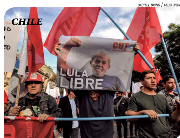
GABRIEL BICHO / MÍDIA NINJA