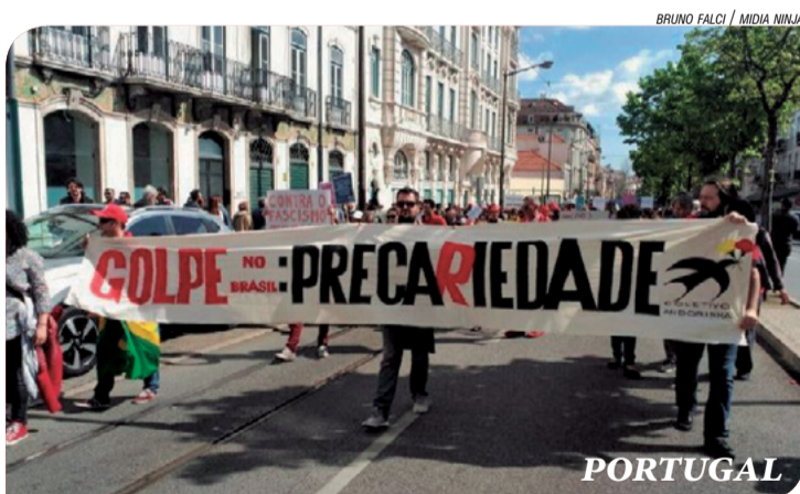
BRUNO FALCI / MÍDIA NINJA